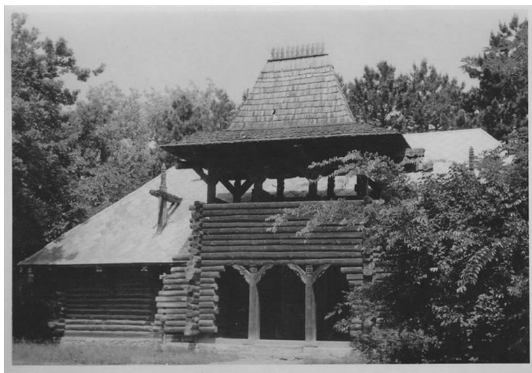
Az egykori fatemplom

Az 1261 hrsz-ú telken kijelölendő új építési övezet helyhez között beruházásnak tekinthető, ezért ezekre nincs máshol megfelelő terület.