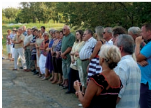
■ Szent Donát emlékmű koszorúzóit