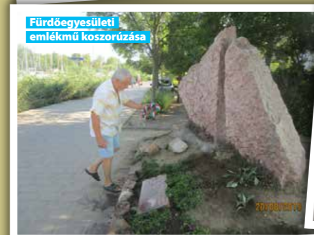
Fürdőegyesületi emlékmű koszorúzása