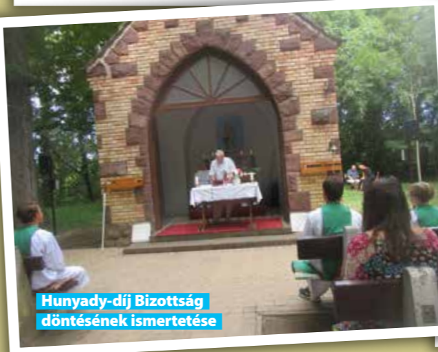
Hunyady-díj Bizottság döntésének ismertetése