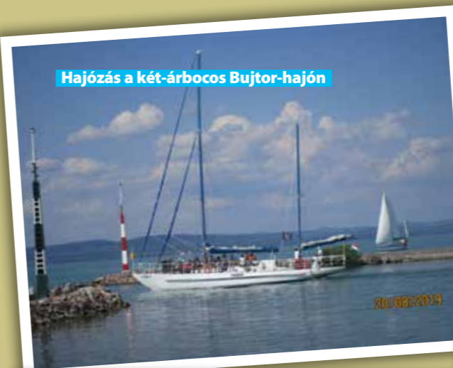
Hajózás a két-árbocos Bujtor-hajón