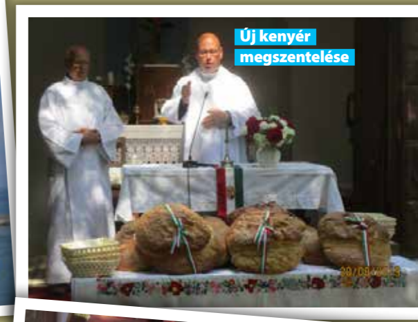
Új kenyér megszentelése