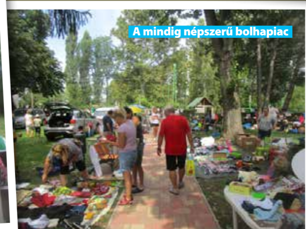
A mindig népszerű bolhapiac