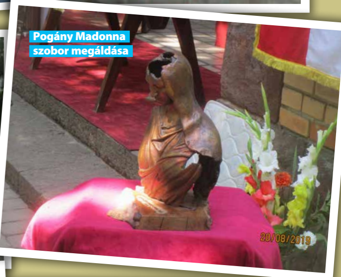
Pogány Madonna szobor megáldása